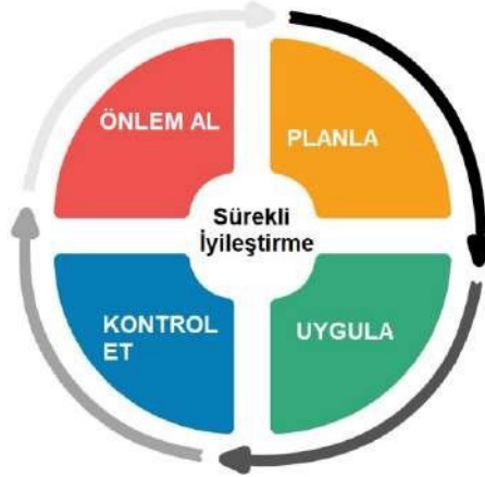
Şekil 1. PUKÖ Döngüsü

Yukarıda belirtilen adımlar özetle Planla-Uygula-Kontrol Et-Önlem Al (PUKÖ) yaklaşımı olarak ifade edilebilir